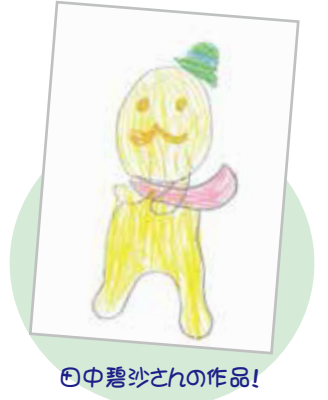
◎中碧沙さんの作品!