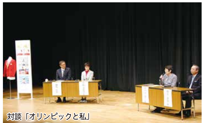
対談「オリンピックと私」

文化の日にあわせて、11月2日(土)・3日(日)に市民文化祭が、11月3日(日)には文化の日のつどいが、コスモシアターや中央公民館で開催されました。たくさんのかたが来場し、音楽サロンや子どもアート広場、ミニだんじり展、作品展示、地車鳴り物・彫刻、市民茶会などに参加し、芸術の秋を満喫しました。