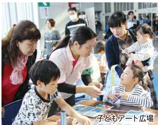
子どもアート広場