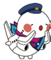
SORAYAN

開空展望ホール「SkyView」で、関西エアポートグループ公式キャラクター「そらやん」と、人気ゆるキャラとの豪華コラボレーションイベントを開催します。キャラクターショーやグリーンティング、抽選会など、盛りだくさんです。詳しくはホームページをチェックしてくださいね。たくさんのご来場お待ちしております!