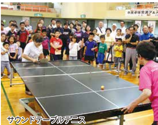
サウンドテーブルテニス