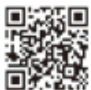
ビーチ&パークランHP

▶問合せ先 貝塚二色の浜ビーチ&パークラン実行委員会事務局(商工観光課内)☎072-433-7192