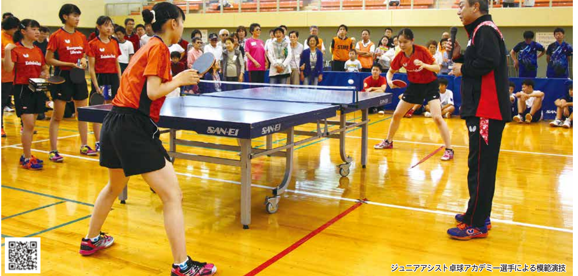
ジュニアアシスト卓球アカデミー選手による模範演技