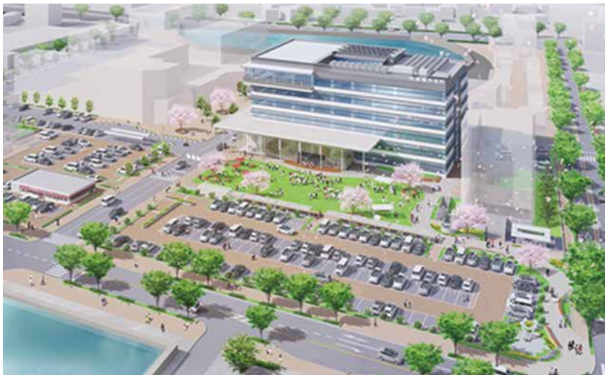
提案イメージ図(今後変更の可能性がります)

市は「民間資金等の活用による公共施設等の整備等の促進に関する法律」(平成11年法律第117号)に基づき、4月に公募型プロポーザル方式による募集を行いました。