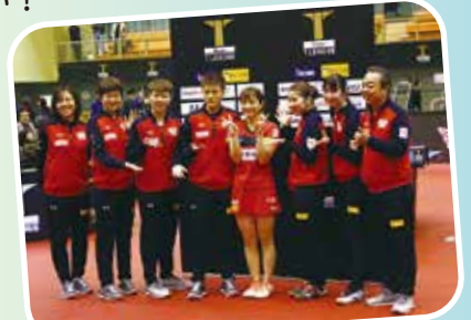
日本生命レッドエルフのみなさん

日時 9月21日(土)午後1時15分~4時30分 (午後0時30分から受付) 場所 市立総合体育館 対象 市内在住・在学・在勤のかた 申込 不要 参加費 無料 持物 体育館シューズ、タオル、ラケット(あるかた) ※ラケットは会場でもご用意します。