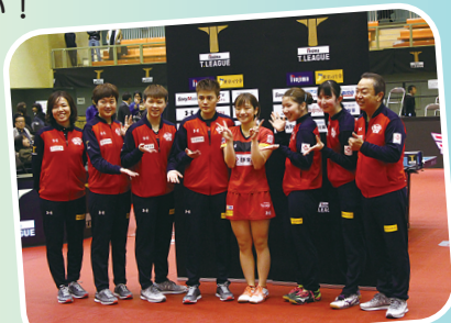
日本生命レッドエルフのみなさん