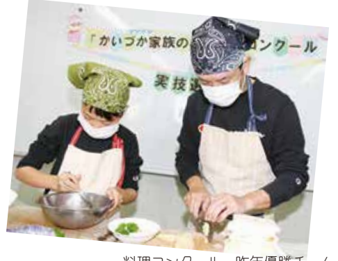
料理コンクール 昨年優勝チーム

応募・問合せ先 〒597-8585 畠中1-17-1 社会教育課 ☎072-433-7125、Eメールkazoku@city.kaizuka.lg.jp