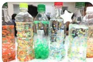
ペットボトルを再利用した作品例

▶日時 8月2日(金)・9日(金)午前9時30分～11時30分▶対象 市内在住・在学で、保護者の送迎が可能な小学3～6年生(保育無し)▶定員 各20人(多数の場合は抽選)▶費用 無料 ▶申込 往復はがきに、参加希望日(第1希望・第2希望)・参加児童の氏名・保護者名・郵便番号・住所・年齢・学年・電話番号を、返信欄には住所・氏名を記入し、岸貝クリーンセンターへ郵送。視覚障害者のかたは電話申込可▶締切 7月16日(火)消印有効