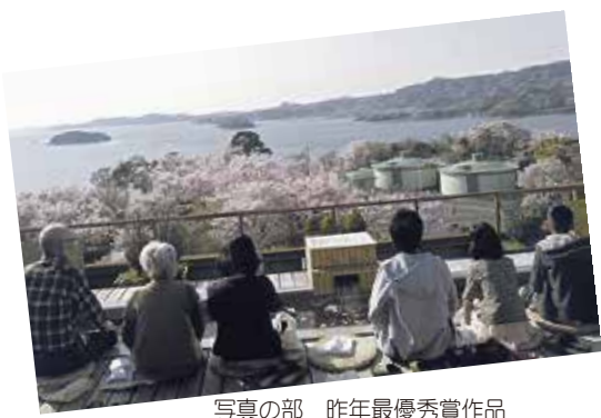
写真の部 昨年最優秀賞作品