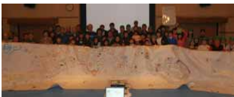
大地図を前に全員で集合写真を撮りました。

最後に体験と見出川への思いを参加者どうし語り合い、「見出川流域の水循環の再生をめざす計画」のキックオフ、取り組みのスタートを宣言して終わりました。