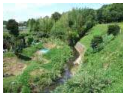
見出川大橋 付近の見出川