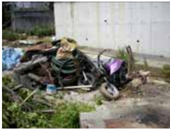
熊取町七山の清掃状況