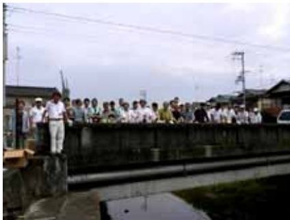
泉佐野市鶴原の清掃状況と 参加者集合写真