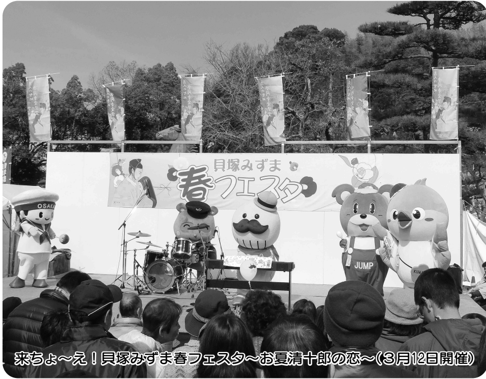
来ちよ～え！貝塚みずま春フェスタ～お夏清十郎の恋～(3月12日開催)