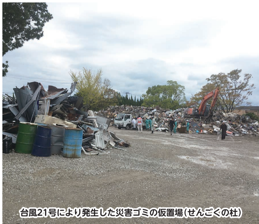
台風21号により発生した災害ゴミの仮置場(せんごくの杜)

平成30年第3回(9月)定例会は、9月10日から28日までの19日間の会期で開催しました。 本定例会には、手数料条例の一部改正の件などの議案10件、平成29年度健全化判断比率報告などの報告7件が提出され、原案どおり可決、人事案件については同意しました。 なお、平成29年度一般会計・特別会計・企業会計の各決算については、決算特別委員会を設置して付託審査し、認定しました。 また、議会議案として、意見書1件を原案どおり可決しました。