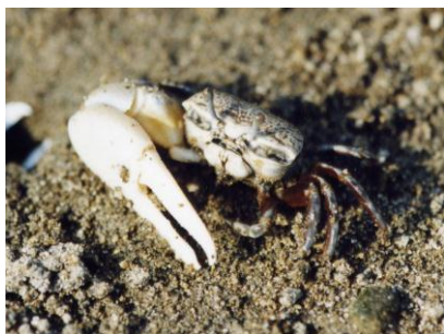
ハクセンシオマネキ