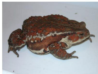
ニホンヒキガエル