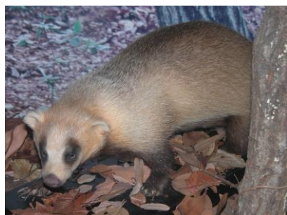
アナグマのはく製