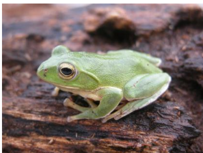
シュレーゲルアオガエル