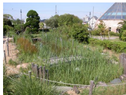
自然生態園「トンボの池」

市民の森公園の一面に 1997 年度より自然生態園づくりが市民ボランティアの手で始められ、現在までに、「トンボの池」、「ドングリの森」、「バッタの原っぱ」、「海辺の植物ブロック」が本市の自然生態系を模して造られています。現在、毎月、自然遊学館わくわくクラブの方々が中心になって、池そうじ、草ぬき、ザリガニ採りなどの維持管理を行なっています。