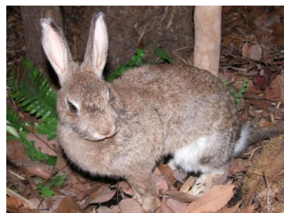
ノウサギのはく製